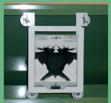
Scatt-analysointi- ja harjoittelulaite