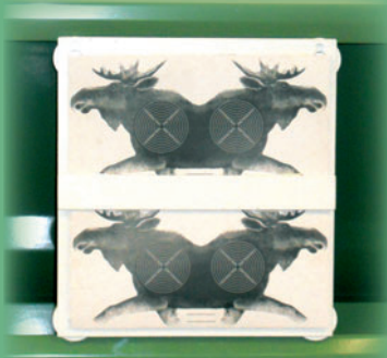
Hirvi päällekkäinen kuva