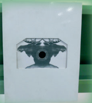
Megalink Hirvi 10 m